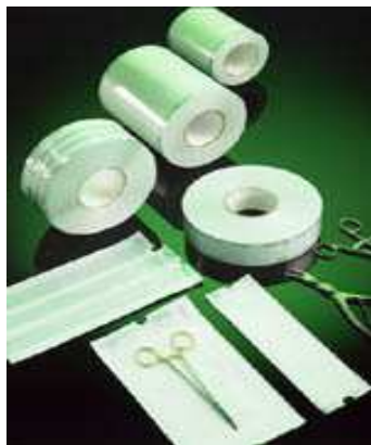
(Buste e Rotoli)