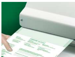
(Test di saldatura)