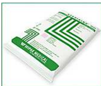
(Test di Bowie & Dick)